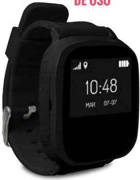
Imagen no contractual